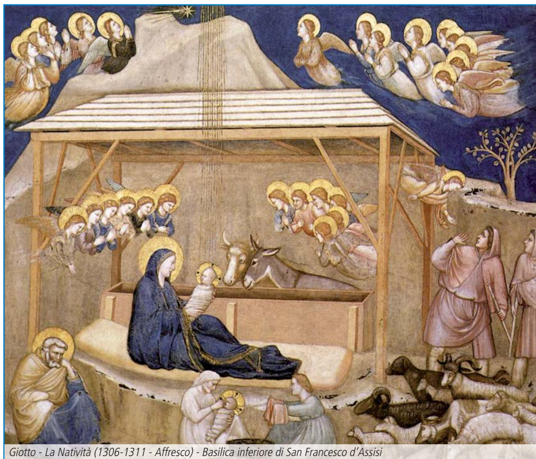
Giotto - La Natività (1306-1311 - Affresco) - Basilica inferiore di San Francesco d'Assisi