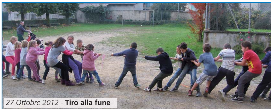
27 Ottobre 2012 - Tiro alla fune

Ricordatevi che il catechismo e l'oratorio sono momenti importanti per stare insieme, divertirsi e imparare in allegria perciò... non perdetevi quest'occasione!