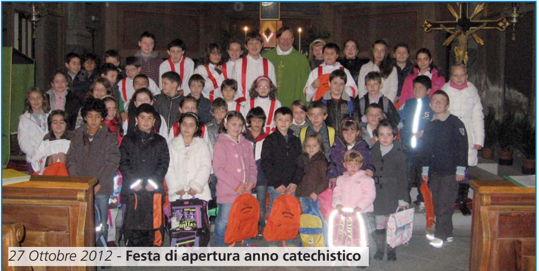
27 Ottobre 2012 - Festa di apertura anno catechistico