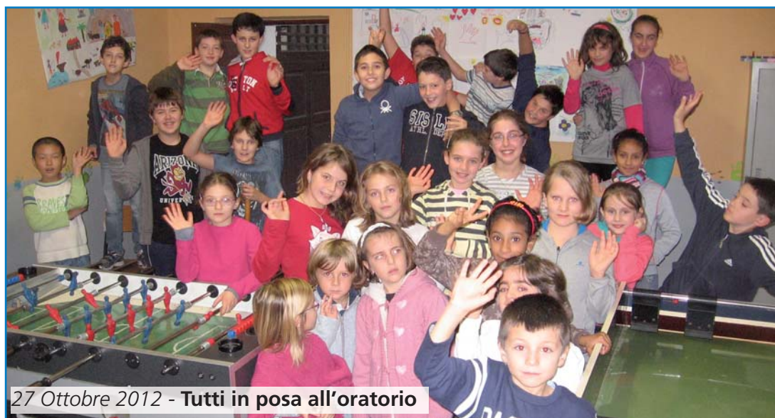
27 Ottobre 2012 - Tutti in posa all'oratorio