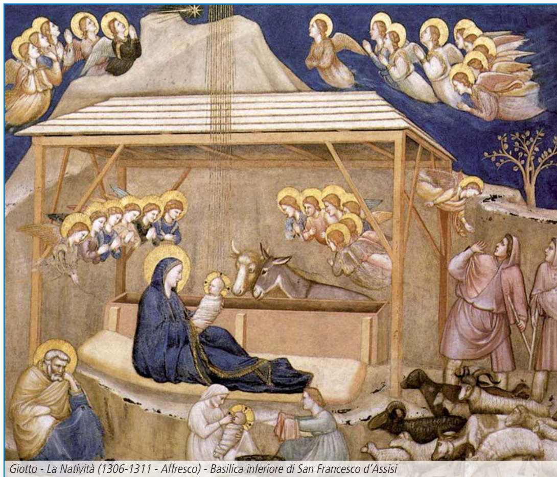
Giotto - La Natività (1306-1311 - Affresco) - Basilica inferiore di San Francesco d'Assisi